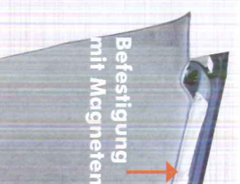
Befestigung mit Magneten