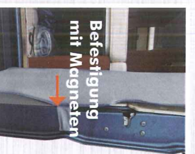
Befestigung mit Magneten

Zweiteilig: für die schnelle Montage mit Magneten an den Hecktüren.